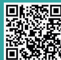
Immagine e grafica di Enrico Dandrea