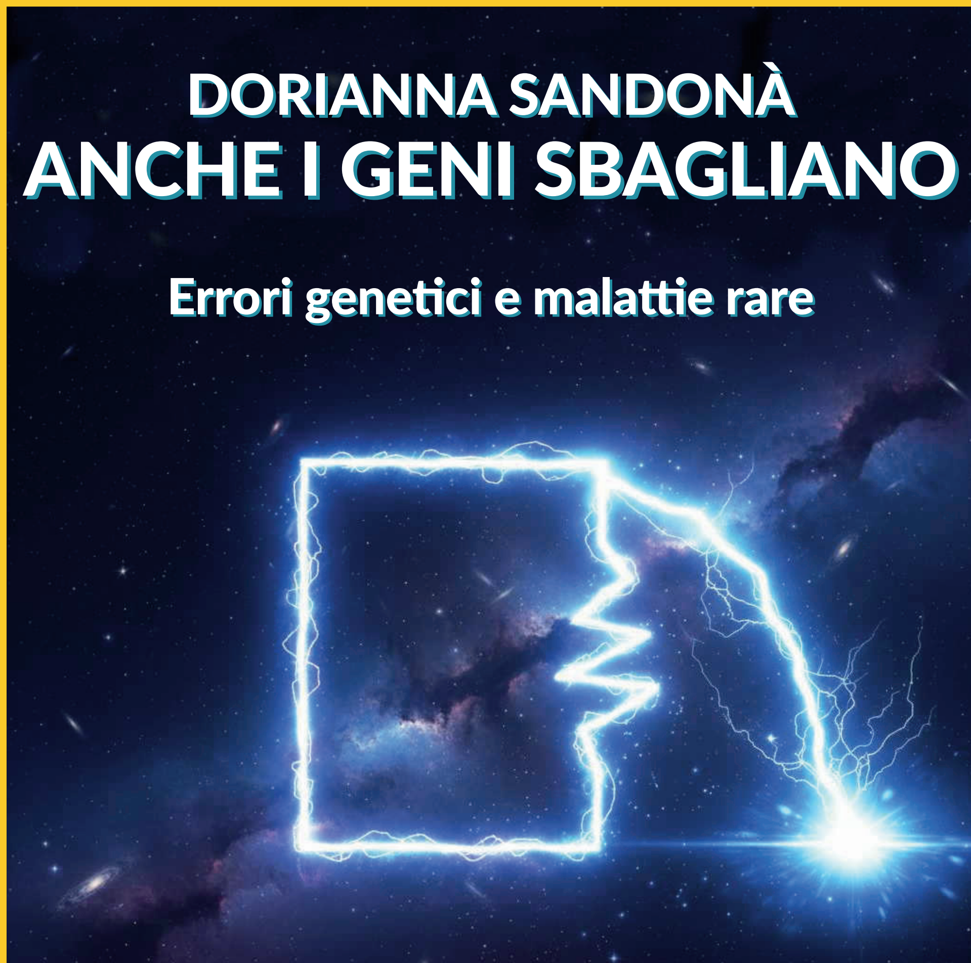
Immagine di Lorenzo Dolfetti e grafica di Enrico Dandrea

Venerdì 30 gennaio 2026 - ore 20.00 AUDITORIUM DELL'ISTITUTO DEGASPERI